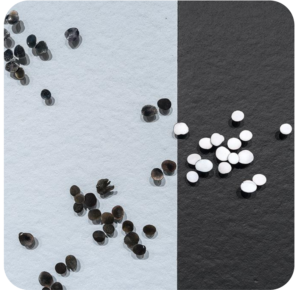
Paradis Anonyme , 2022 de Yen-Chao Lin

Toi, souhaiterais-tu quitter ta ville, ton pays, ton continent pour refaire ta vie ailleurs? Si oui, où aimerais-tu t'établir? Et pourquoi choisirais-tu cet endroit du monde?