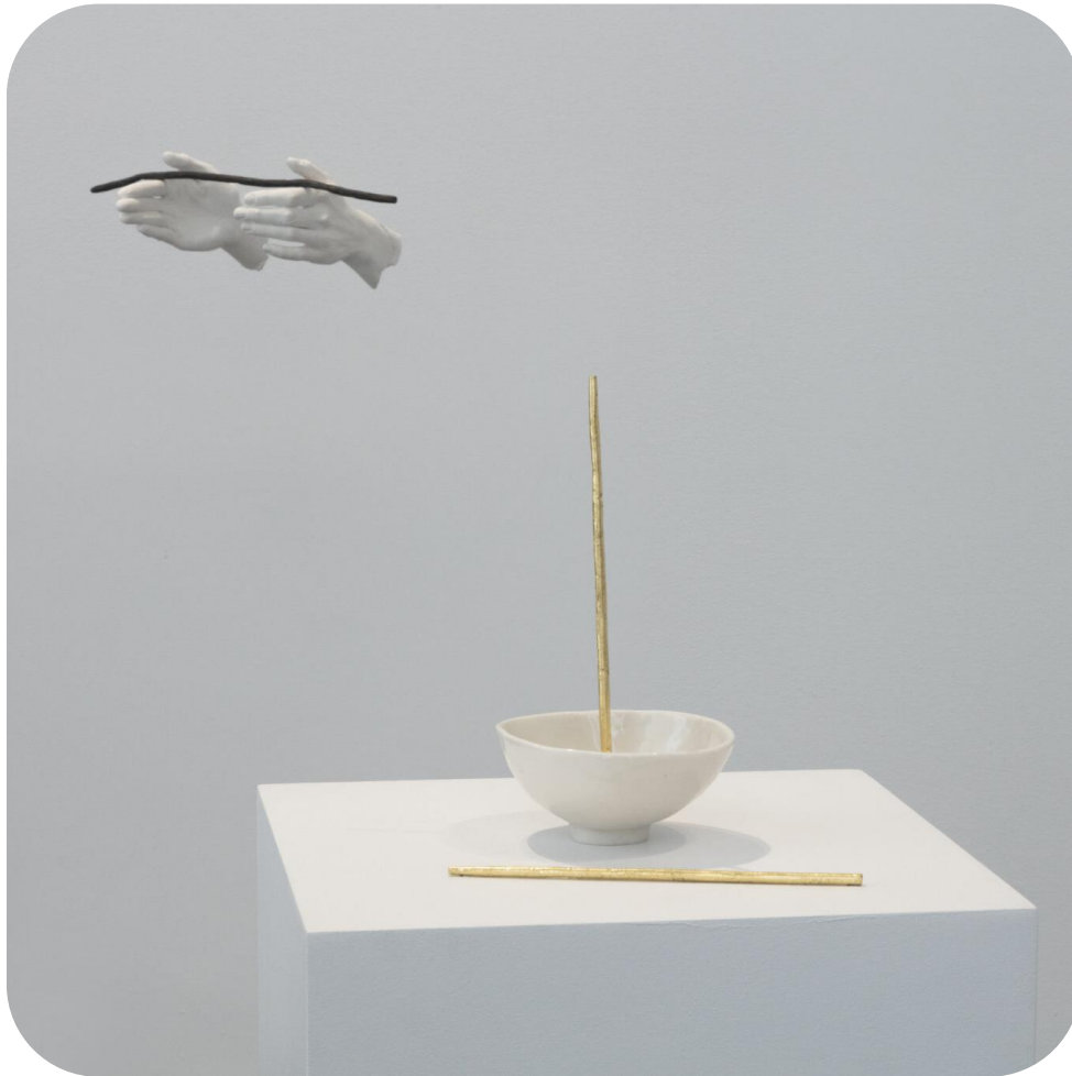
The Eroding Garden

L'intuition est un ressenti très subtil, une compréhension subconsciente basée sur l'expérience. Elle est très présente dans l'exposition de Yen-Chao Lin puisqu'elle lie les trois œuvres présentées.