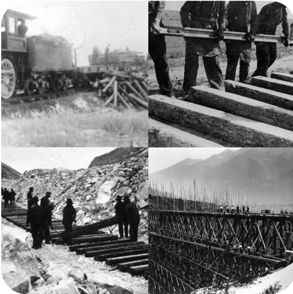
Construction du Canadian Pacific Railway

Le Canadian Pacific Railway a été fondé en 1881 pour relier le Canada d'un océan à l'autre.