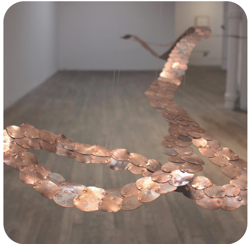
As Above, So Below , 2025

Il existe une Loi sur la Monnaie Royale Canadienne qui interdit de fondre, briser ou détruire une pièce de monnaie en circulation, sous peine d'amendes et d'emprisonnement.