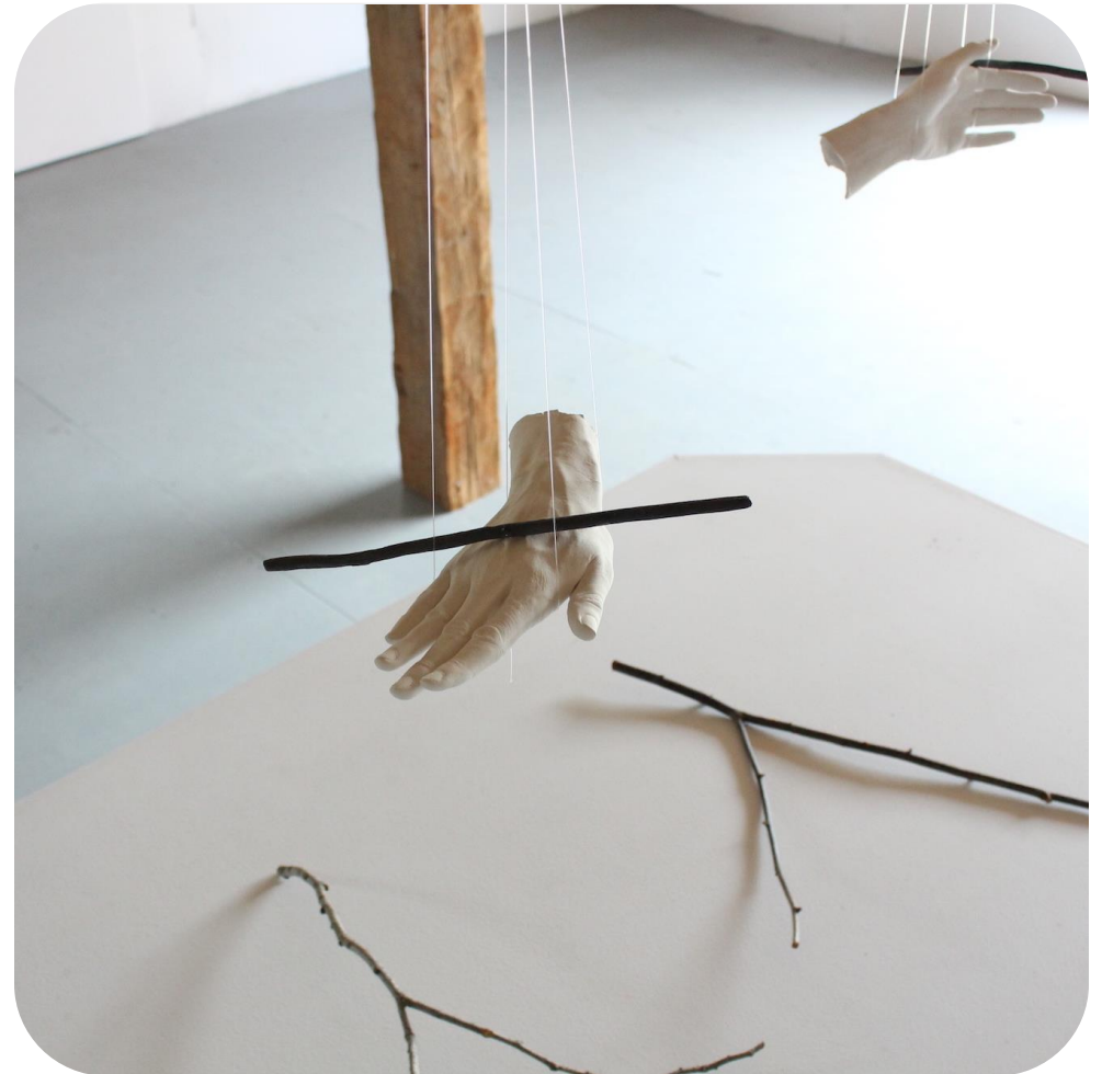
Titre : The Eroding Garden , 2019

Des trois œuvres que nous présente Yen-Chao Lin, deux sont des installations et l'autre est une murale.